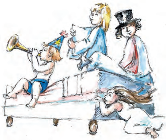
ILLUSTRATION : FRANÇOIS CONTESSÉ